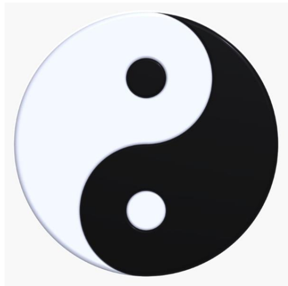
Symbole du Yin-Yang

Le symbole du Kundalini représenté par deux serpents entrelacés, un noir et un blanc, qui représentent les canaux d'énergie ou nadis, et le symbole taijitu du YIN-YANG, promettent qu'un éveil et une maîtrise des énergies opposées de l'obscurité et de la lumière engendreront une ascension ou une complétude de l'être (« les deux moitiés qui ensemble complètent l'intégralité »).